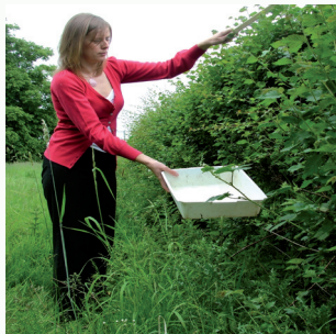
Method 1: Defnyddio cynhwysydd lliw golau

Nawr defnyddiwch y Canllaw Adnabod Infertebratau i'ch helpu i adnabod pob dim.