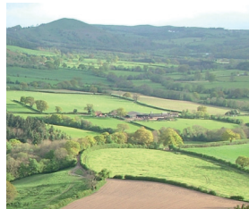
Perthi ffin, Swydd Amwythig