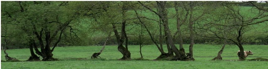
Plannwyd y rhes hon o goed yn wreiddiol fel perth

Plannwyd llawer o berthi'n wreiddiol fel rhwystrau i gadw da byw mewn un lle. Plannwyd eraill i nodi ffiniau, fel cyrion plwyf, neu i ateb gofynion Deddfau Clostroedd Seneddol. Deddfau Seneddol yw'r rhain a basiwyd rhyw 150-200 o flynyddoedd yn ôl yn nodi ffiniau tir preifat. Roedd llawer yn manylu ar sut dylid marcio'r ffin, sef plannu perth neu godi wal gerrig gan amlaf. Yn ystod y blynyddoedd diwethaf, mae'r Deddfau hyn wedi cael eu defnyddio mewn Llysoedd Barn i atal cael gwared ar berthi a hyd yn oed i sicrhau bod perthi newydd yn cael eu plannu yn lle rhai a dynnwyd.