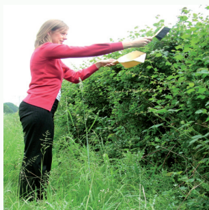
Method 2: Defnyddio padell ludw a brwsh

Os nad ydych chi'n siŵr beth yw rhywbeth, postiwch ffotograff i www.ispotnature.org a bydd rhywun yn gallu'ch helpu i'w adnabod.