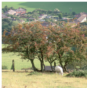
Perth o ddraenen wen wedi ei hesgeuluso, gyda chyflenwad da o aeron, ond heb fawr o gysgod i fywyd gwyllt, Canolbarth Cymru