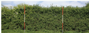
Marcio dechrau a diwedd y darn 3 metr

Dewiswch ddarn 3 metr o hyd sy'n nodweddiadol o'r berth gyfan. Marciwch ddechrau a diwedd y darn 3 metr cyn dechrau'r gweithgareddau.