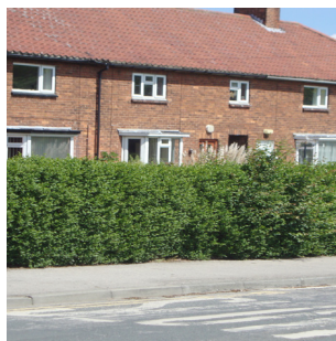
Perth drwchus o yswydd, gyda digon o gysgod ar gyfer bywyd gwyllt ond heb fawr o aeron, Manceinion.

Mae Gweithgaredd 4 yn asesu pwysigrwydd y berth fel ffynhonnell o loches a diogelwch. Mae gwahanol anifeiliaid yn gwneud tyllau o wahanol faint. Mae'n debyg y bydd twll â chylchfesur o lai na 2cm wedi'i wneud gan bryf, twll 2-5 cm wedi'i wneud gan lygoden neu bathew, twll 5-10 cm gan lygoden fawr, 10-30 cm gan gwningen a thwll sy'n fwy na 30 cm gan gadno/llwynog neu fochyn daear.