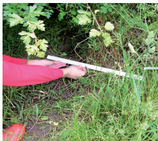
Measuring holes along the hedge

Defnyddiwch y tâp mesur yn eich pecyn i fesur maint y tyllau yn y ddaear ar hyd eich darn chi o berth. (Cwestiwn 19). Dim ond tyllau sydd heb unrhyw ddail, cerrig, pridd rhydd neu deilchion eraill ddylech chi eu cofnodi.