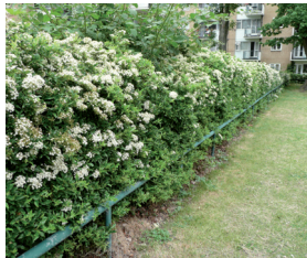
Perth ardd, Llundain

Mae Arolwg Bioamrywiaeth OPAL yn canolbwyntio ar berthi fel man i ddod o hyd i fywyd gwyllt diddorol.